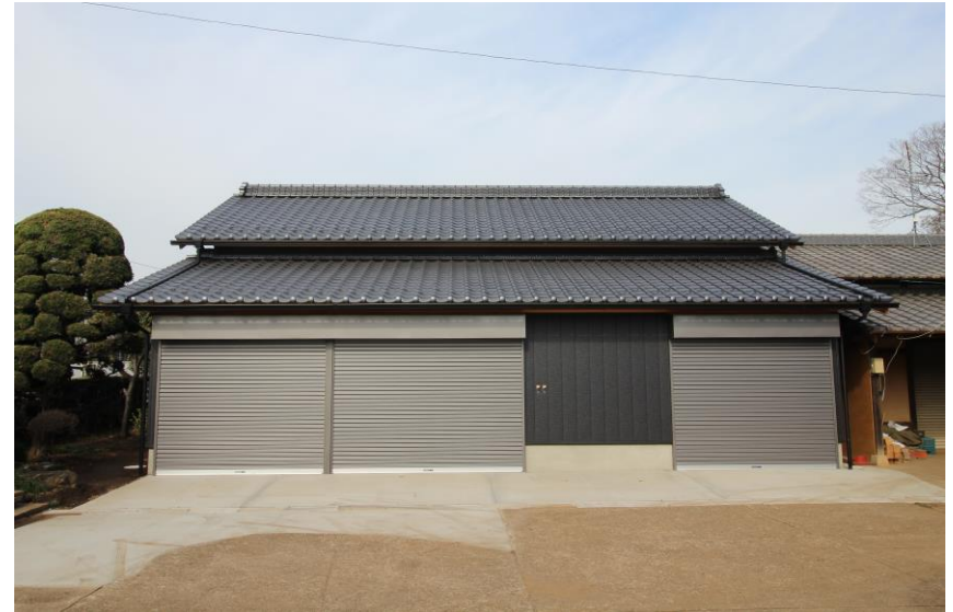
N様邸車庫兼倉庫新築工事 竣工いたしました 屋根廻りは垂木・野地板・破風板などがヒノキの化粧仕上げになっています 後日HPに掲載いたします

浴室のユニットバス設置工事や窓の断熱改修などを考えている方は、結構お得になりますのでご連絡をお待ちしております。